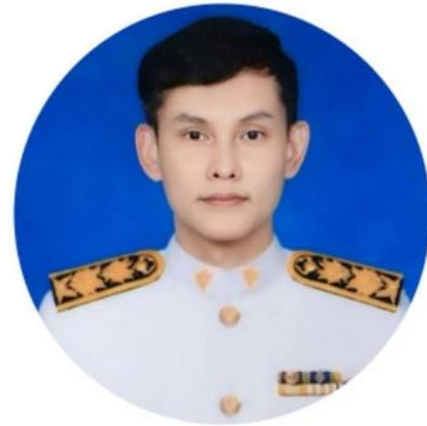
หัวหน้ากลุ่มงานยุทธศาสตร์ หรือผู้แทน สำนักงานเขตสุขภาพที่ 8