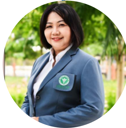
ผู้อำนวยการศูนย์สุขภาพจิตที่ 8 อุตรธานี หรือผู้แทน