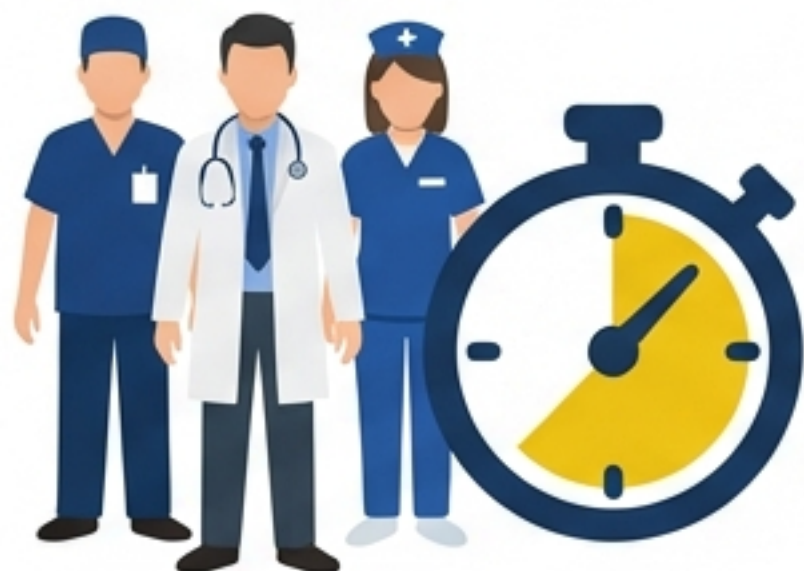
Sepsis Champion Team