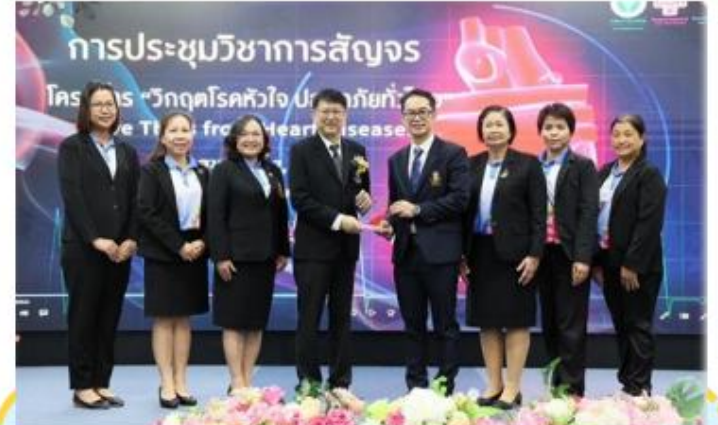
รับโลเกียตริคุณด้านการบริหารจัดการข้อมูล ผู้ป่วยโรคหัวใจ เขตสุขภาพที่ 8 ในโครงการ Save Thais From Heart Diseases