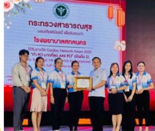
รับประกาศนียบัตร Cardiac Network Forum Award 2025