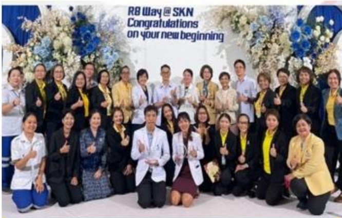
ผลงาน Service Plan ดีเยี่ยม ประจำปี 2567