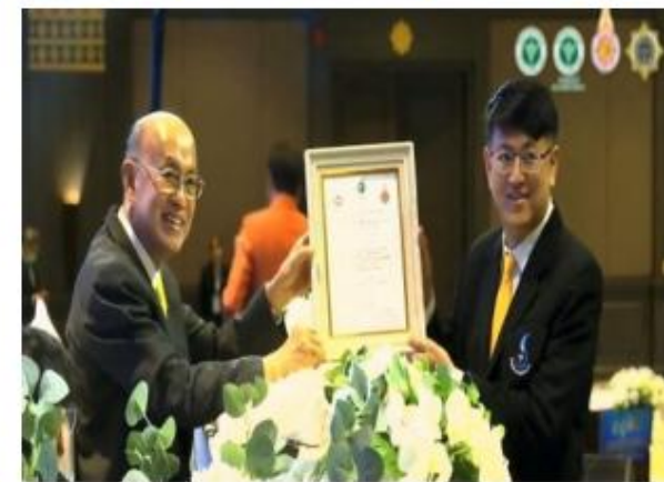
โรงพยาบาลสกลนคร