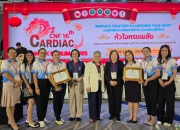
• AMI การเข้าถึงการรักษา Reperfusion มากที่สุด ระดับจังหวัดมี Cath Lab (อันดับ 1) • ทำ PCI มากที่สุด AMI PCI (อันดับ 2 )