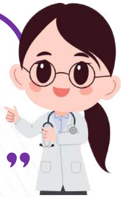
เดือนสิงหาคม 2568