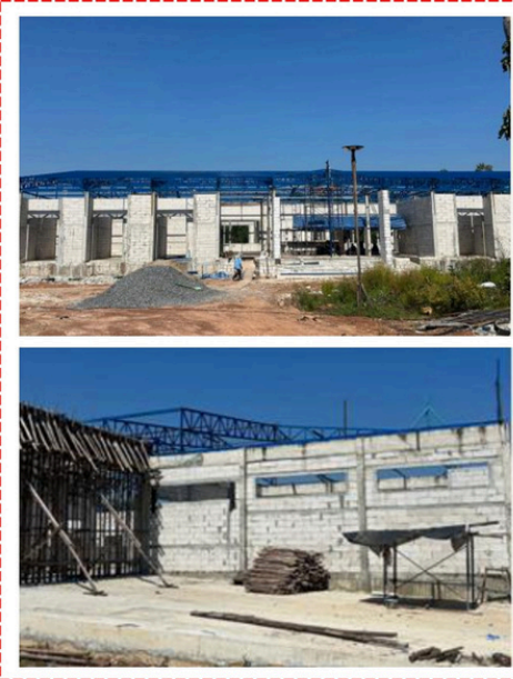
อาคารผู้ป่วยใน งวดที่ 6 ภาพการก่อสร้าง ณ วันที่ 7 ตุลาคม 2567 ก่อสร้างได้ 60%