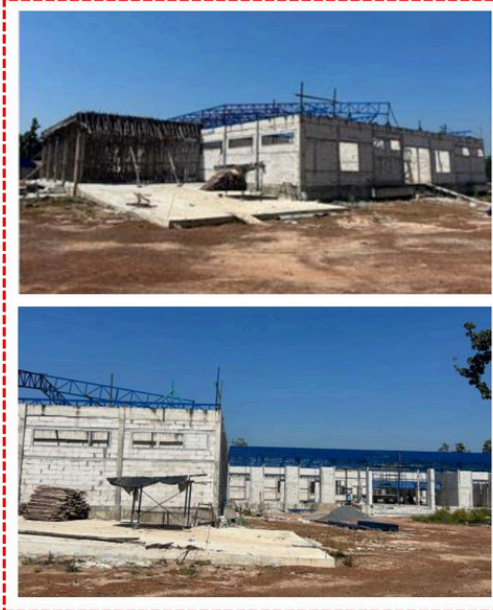
อาคารผู้ป่วยนอก/ฉุกเฉิน/ กายภาพบำบัด/แผนไทย งวดที่ 6 ภาพการก่อสร้าง ณ วันที่ 7 ตุลาคม 2567 ก่อสร้างได้ 60%

ความคืบหน้าโครงการก่อสร้างโรงพยาบาลพระอาจารย์มั่น ภูริทัตโต ศูนย์ชัชวาลิมบองการุณย์เวช อำเภอบ้านม่วง จังหวัดสกลนคร