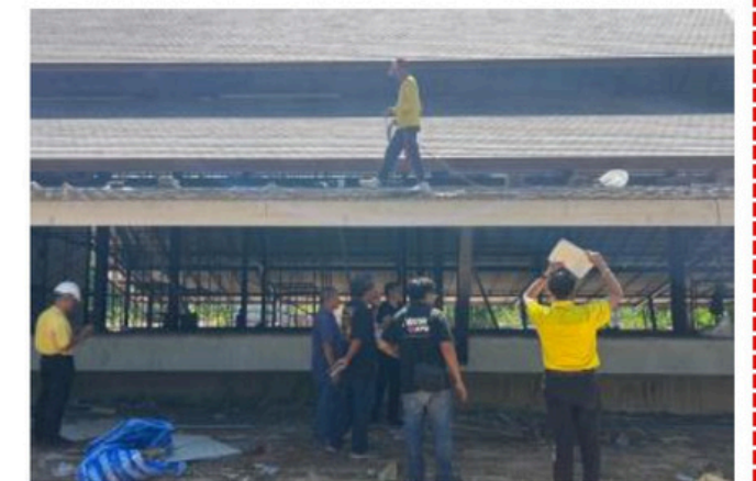
หอธรรมจินดาสุข งวดที่ 5 ภาพการก่อสร้าง ณ วันที่ 7 ตุลาคม 2567 ก่อสร้างได้ 80%