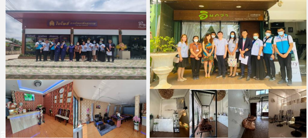
1. ไบโพรธีนวดไทยเพื่อสุขภาพ 2. อินถวานวดเพื่อสุขภาพ