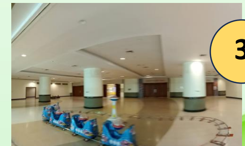
โรงแรมเซนทรา อุดรธานี