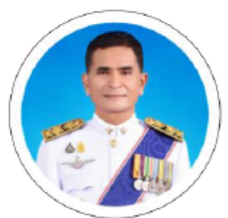
นพ.จรัญ จันทมัตตการ สาธารณสุขนิเทศก์ เขตสุขภาพที่ 8