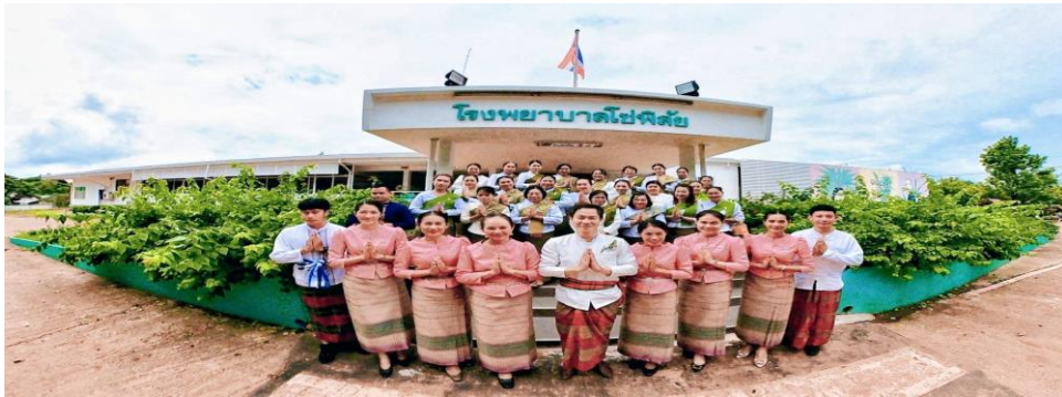
โรงพยาบาลโซ่พิสัย